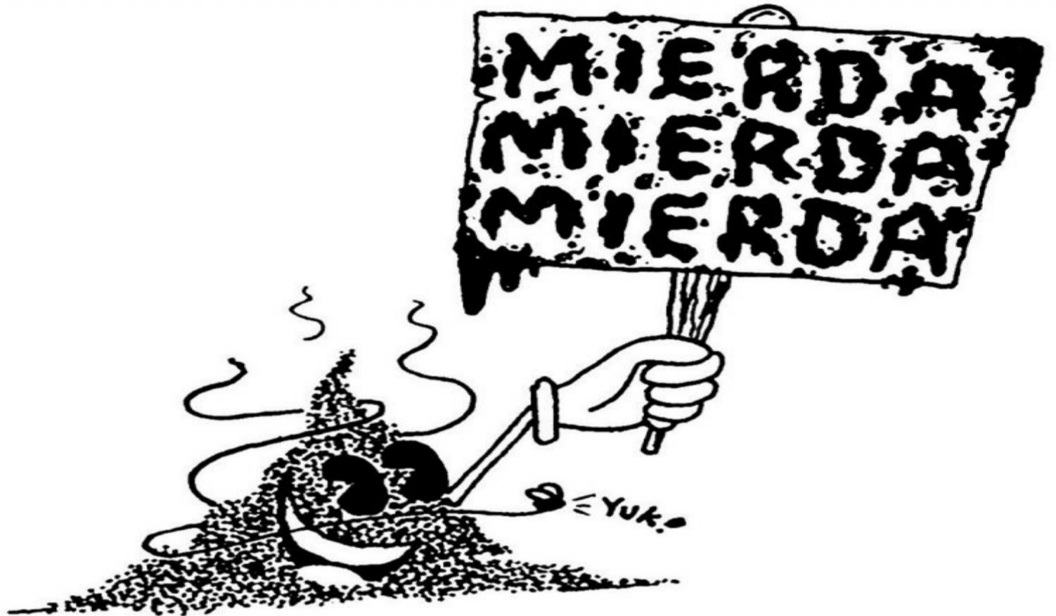
Y si eso sucede, en este país puede llover mierda al zarzo

Es entonces cuando la mierda que va a llover al zarzo va a alcanzar hasta para empañetar.