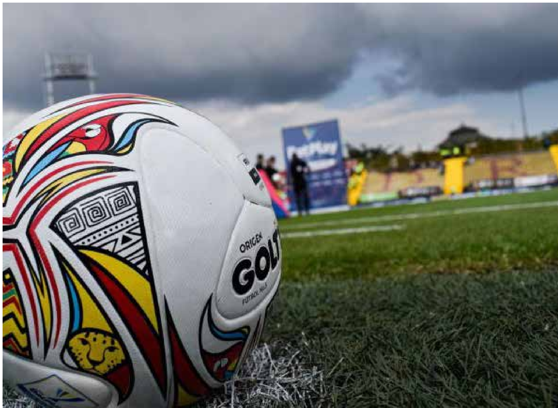
Fútbol en Colombia