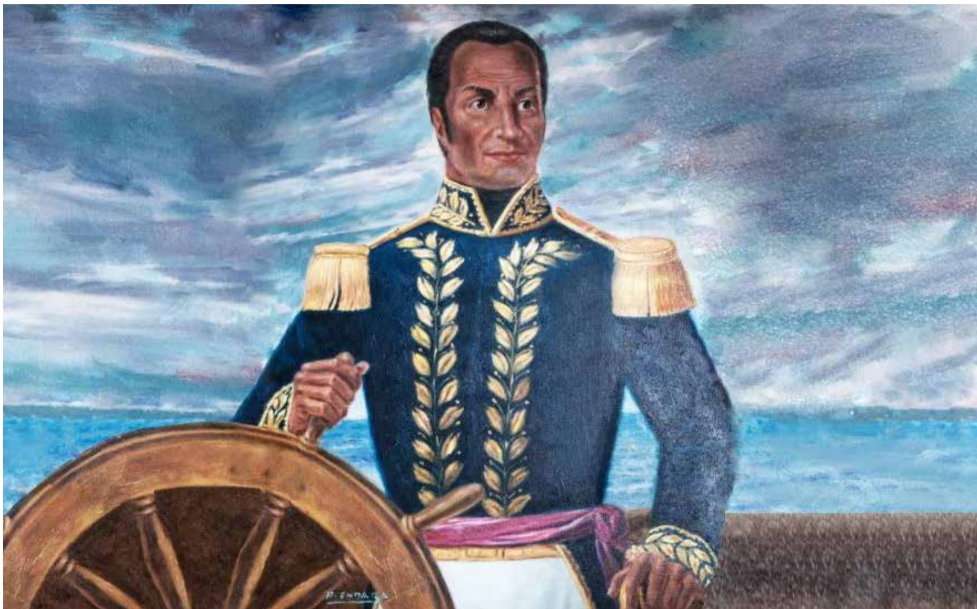
Almirante José Prudencio Padilla López

195 años después de su fusilamiento, el máximo prócer naval colombiano, el Almirante José Prudencio Padilla López fue ascendido, por el presidente de la República Gustavo Petro Urrego, de manera póstuma y honorífica, al grado de Gran Almirante de la Nación.