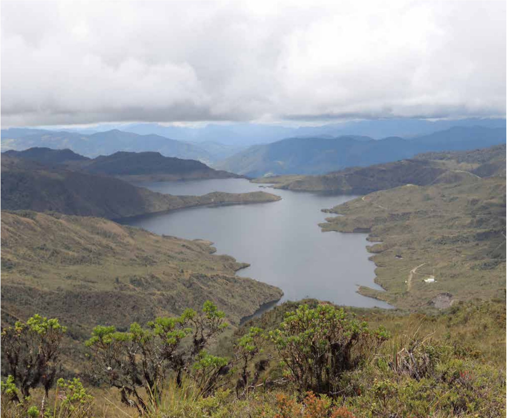
Fotografía de la represa de Chingaza entregada por el gobierno de Bogotá señalando las causas del racionamiento de agua en Bogotá y municipios circunvecinos

fuentes, poca conservación y oferta limitada, habrá sequías.