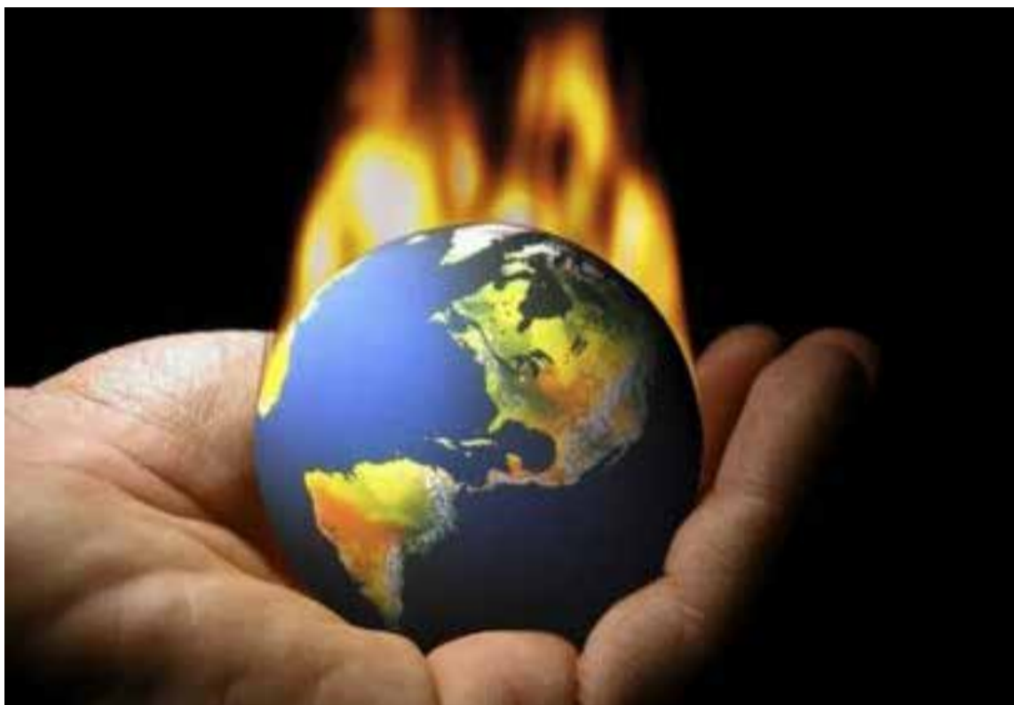
Si el hielo polar continúa derriéndose, los bosques reduciéndose y los gases de efecto invernadero aumentando a nuevos máximos -como ocurre actualmente cada año- la Tierra llegará a un «punto de inflexión», es decir, un punto de daño irreversible para el planeta.

Para fines de siglo o incluso antes, los ríos se