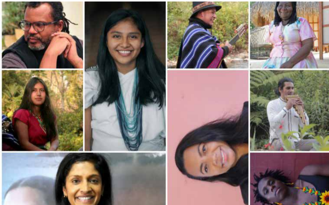
La Juntanza Étnica estará presente en FILBO 2024

Los demás espacios de la agenda étnica son: Entre el Caribe y el Pacífico: