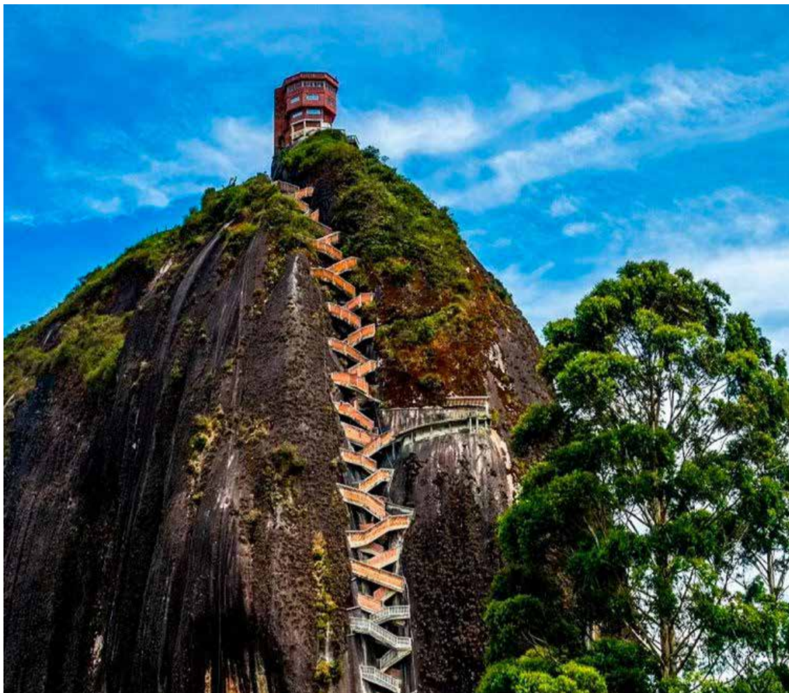
El Peñón de Guatapé a un monolito de 220 metros de altura localizado en el municipio que lleva su nombre.

La Piedra, compuesta por cuarzo, feldespato y mica, fue escalada por