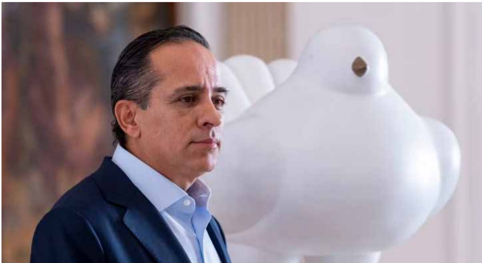
Alexander López director Departamento Nacional de Planeación

E l Departamento Nacional de Planeación (DNP) determinó que los 32 departamentos, 982 municipios, Bogotá, y 50 entidades, como universidades, corporaciones autónomas regionales (CAR), podrán seguir aprobando y ejecutando proyectos del Sistema General de Regalías (SGR) de forma directa durante el año 2024.